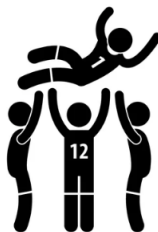
Voetbal fun tov winnen