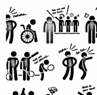
Geen discriminatie geen intimidatie