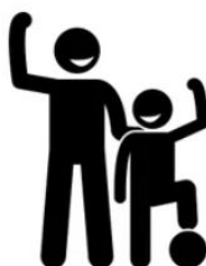
Geen instructies maar supporter